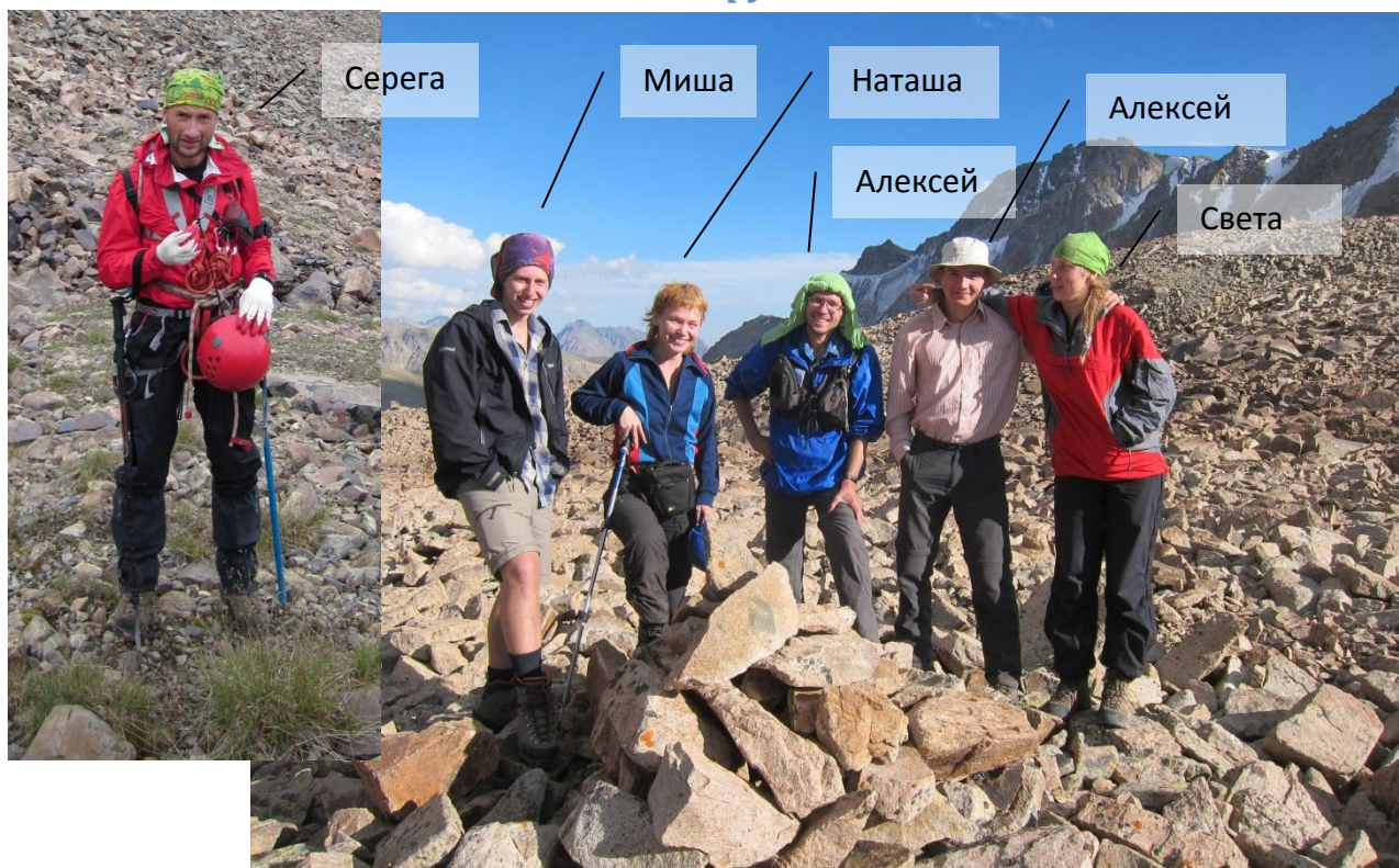
Группа у тура на перевале Тентек (1А)